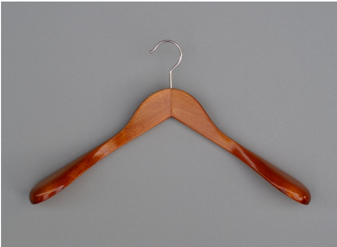
Modellkleiderbügel mit breiter Schulterauflage Jacken und Mäntel hängen perfekt

Rom Stabiler Buchenholzkleiderbügel aus einem Stück Farbe; natur, kirschbraun, mahagony, nussbraun, weiß