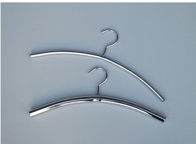
Rohrkleiderbügel Chrombügel glänzend Artikel 501 13mm stark Artikel 502 22mm stark